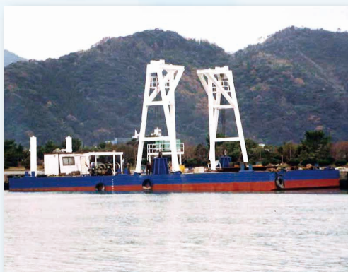
スパット台船(平台船)