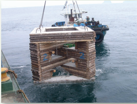
間伐材魚礁設置事業