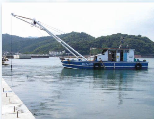
第12たんぼぼ(潜水土船)