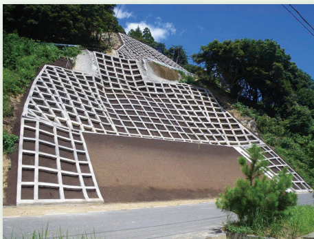
災害復旧法面工事