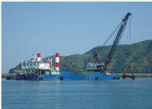
小浜漁港浚渫工事