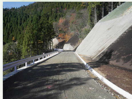
林道開設工事 森林基幹道開設工事 若狭遠敷線