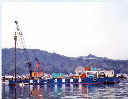
第12久須夜号(平台船)