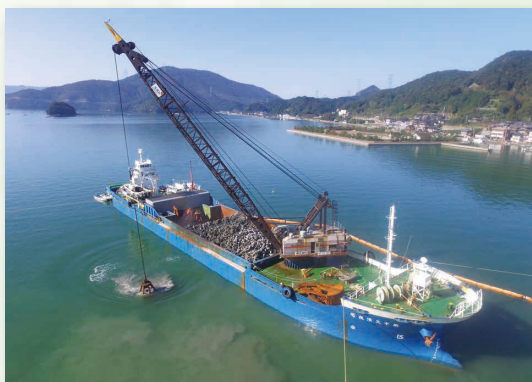
漁港施設整備工事(宮留防波堤)

未来のフィールドは、限りなく。 人と技術の調和をはかり、 柔軟性のある 事業展開を推進します。