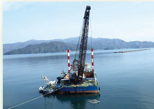
小浜湾内藻場造成工事